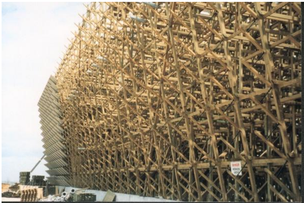
クーリングタワー (AUS)

保存処理木材の使用量は、日本よりも海外の方が圧倒的に多く、多方面に利用されています。