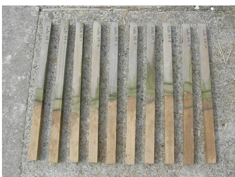
タナリス CY 処理